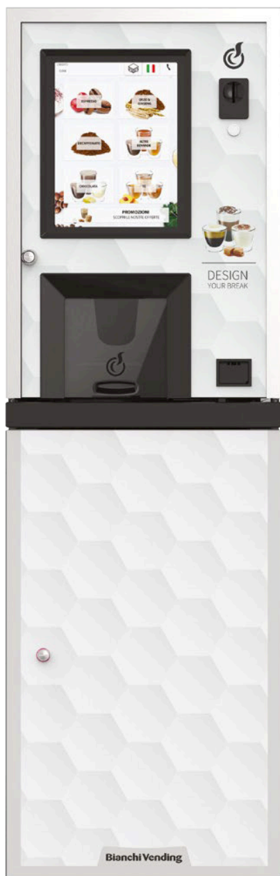
LEI250 TOUCH15" + CABINET STICKER KIT WITH "DESIGN YOUR BREAK" GRAPHIC (OPTIONAL)